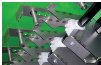
Rulli a doppio dente